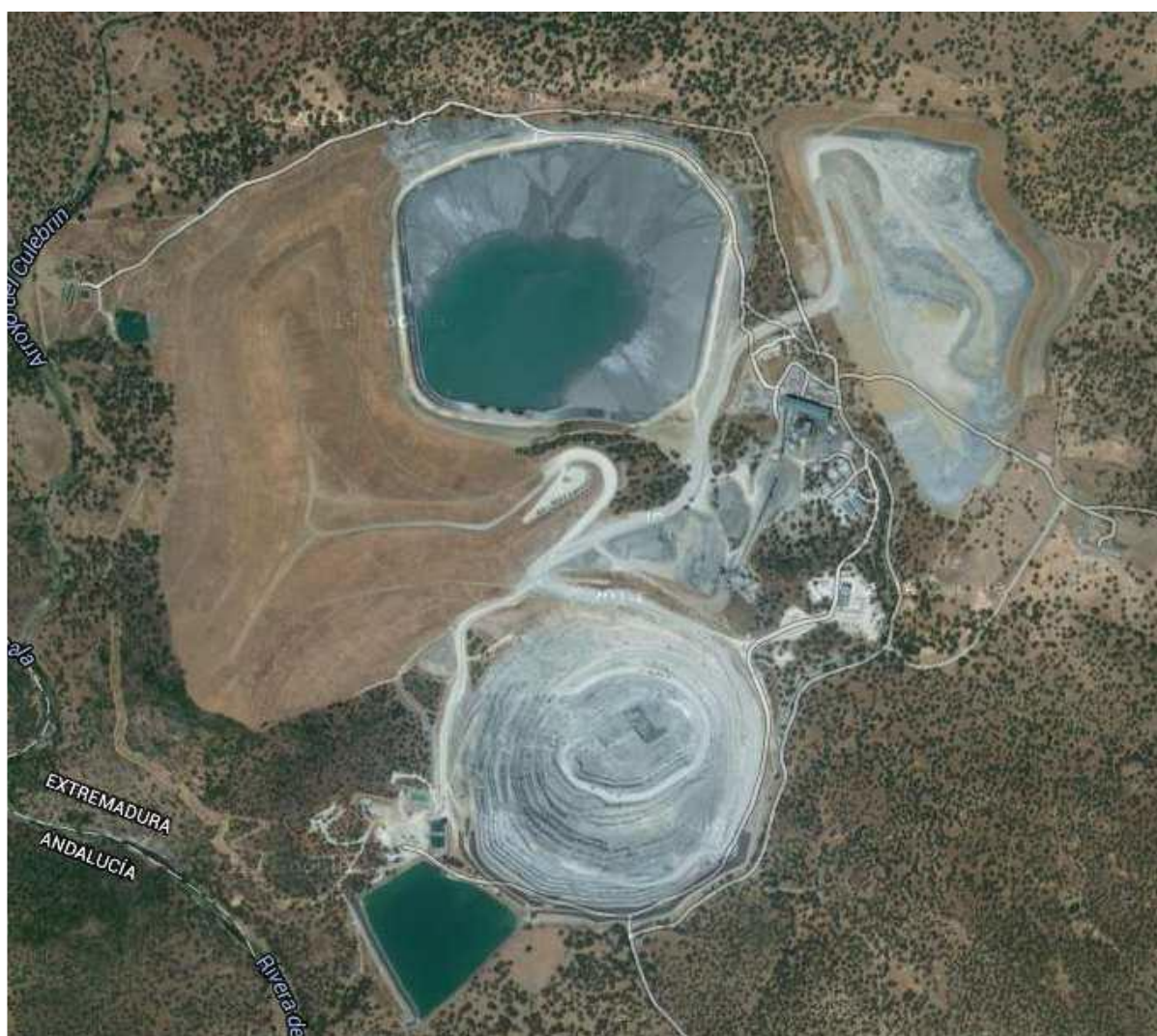
Mina de Ni-Cu de Aguablanca (Badajoz)